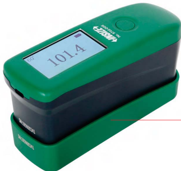
底座(含校准块, 标配)